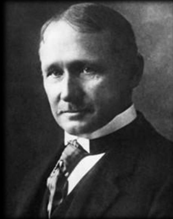
Frédéric Winslow TAYLOR (1856 – 1915)